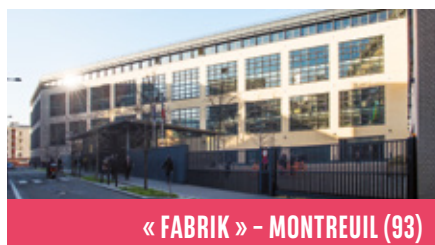
« FABRIK » - MONTREUIL (93)

Immeuble de bureaux « Fabrik » à Montreuil (93). Acquisition par votre SCPI le 8 mars 2019.